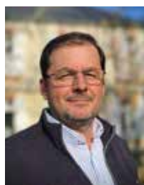
Hugues LEGENDRE Maire de Saint-Aigulin