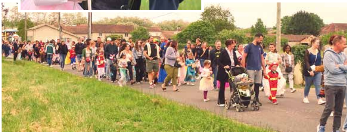
La foule était très nombreuse pour ce défilé 2026.