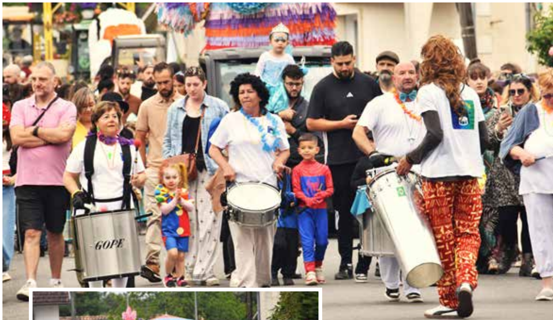
Un carnaval haut en couleurs !